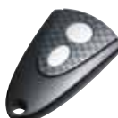
Handsender Micro-Novotron 512 Design 2-Kanal, 433 MHz, Keeloq-Wechselcode