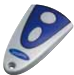
Handsender Mini-Novotron 502 2-Kanal, 433 MHz, Keeloq-Wechselcode

Hier finden Sie eine Auswahl an Novoferm Zubehör für Ihre Wunschausstattung: