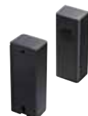
Gegenlichtschanke Extra 625 24 V DC, IP 54, Reichweite: 8 m

Weiteres Zubehör finden Sie unter www.novoferm.de