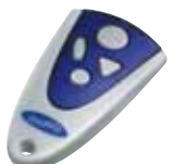
Handsender Mini-Novotron 504 4-Kanal, 433 MHz, Keeloq-Wechselcode