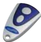
Handsender Micro-Novotron 512 2-Kanal, 433 MHz, Keeloq-Wechselcode