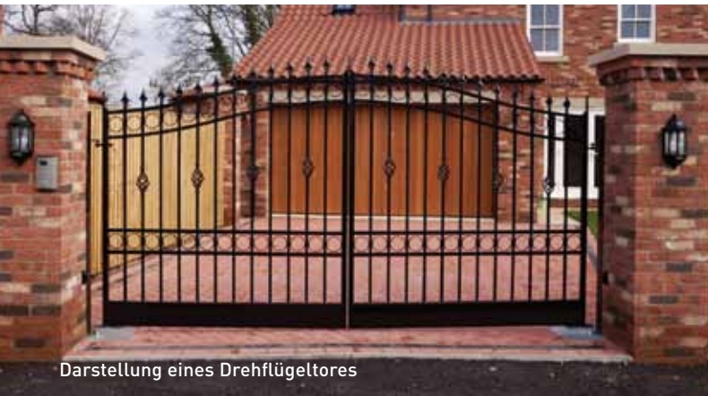
Darstellung eines Drehflügeltores