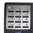
Funk-Codetaster Signal 218 10 Codes, 433 MHz, Keeloq-Wechselcode, mit hinterleuchteter Edelstahlblende