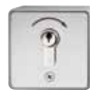
Schlüsseltaster Signal 412 Aufputz, 1-fach-Schaltimpuls (1 Tor)